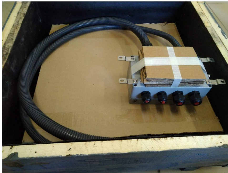
Рисунок 2. – Укладка распределительной коробки

Сверху на заднюю крышку монитора уложить амортизирующую прокладку (гофрокартон) и на нее, завернув гофра-рукава, распределительную коробку, как показано на рисунке 2. (коробку расположить в области задней крышке монитора)